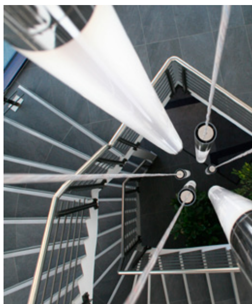
Egal welche Leuchte: DALI ist universell einsetzbar

Das Digital Addressable Lighting Interface (DALI) ermöglicht die Ansteuerung von Leuchten aller Art. Die Steuerleitung kann in fast beliebigen Topologien mit bis maximal 300 Metern Leitungslänge installiert werden. Dadurch sind auch komplexe Beleuchtungskonstellationen mit vertretbarem Aufwand möglich, zumal die zweiadrige Steuerleitung zusammen mit der Versorgungsleitung beispielsweise in einem fünfadrigen Standardkabel geführt werden kann. Das bedeutet im Vergleich zur herkömmlichen Verdrahtung Einsparpotenziale sowohl beim Material- als auch im Zeiteinsatz – den deutlichen Komfortgewinn bei Installation und Wartung noch nicht einmal mitgerechnet.