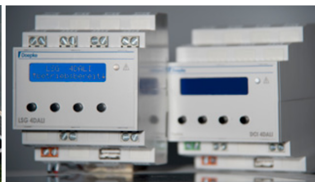
▲ Äußerlich ähnlich, innen verschieden: Die Lichtsteuergeräte für herkömmliche Verdrahtung (links) und für die Ankopplung an Dupline

Die DALI-Gateways von Doepke ermöglichen den Betrieb von bis zu 64 elektronischen Vorschaltgeräten (EVG) an einem Bus, die zu maximal sechzehn Gruppen zusammengefügt werden können. Maximal sechzehn speicherbare Lichtszenen garantieren größtmögliche Flexibilität. Zur Vermeidung von unerwünschten Eingriffen ist die Lichtszenenspeicherung sperrbar. Die Vergabe der