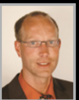
Ralf Schüler Entwicklung

Abhilfe – lässt man die Störaussendung einmal außer Acht – schafft in beiden Fällen nur eine drastische Leistungsreduzierung gegenüber der angegebenen (ohmschen) Maximallast des jeweiligen Dimmers. Für Doepke-Dimmer gilt als Richtwert: \frac{1}{4} der Nennlast bei Phasenanschnitt, \frac{1}{2} der Nennlast bei Phasenabschnitt. Bei Phasenabschnitt benötigt man eine parallelgeschaltete ohmsche Grundlast (Glühlampe > 10 W oder Grundlastelement FS-GE), um die minimale Dimmhelligkeit erreichen zu können. Bei Phasenanschnitt kann diese notwendig sein, um die Lampe komplett ausschalten zu können. ■