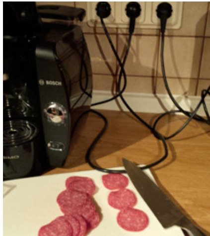
► Im Schnitt passieren die meisten Unfälle im Haushalt.

Bei all dem Kürzelwirrwarr, sei es FI, RCCB, DI oder RCD, das uns aus der Fachwelt oftmals zugemutet wird, nennen wir unsere kleinen Lebensretter ganz liebevoll und einprägsam „Fidi“. Ob nun FI für den Fehlerstromschutz oder DI für die Differenzstromüberwachung: So oder so schützt Fidi uns völlig anspruchslos rund um die Uhr in seinem stillen Verteilerlein vor den Folgen gefährlicher Isolationsfehler.