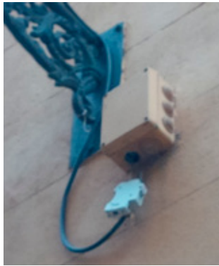
▲ Abschalten im Urlaub

Mit dem Namen Fidi mögen einige von Ihnen die Kurzform für Friedrich, Friederike oder auch Elfriede verbinden. Im Ostfriesischen zumindest durchaus üblich. Ähnlich aber, wie Landwirte oder Haustierbesitzer ihren allerliebsten (Tieren) Namen geben, tun das in unserer Gegend auch Elektroinstallateure einer liebgewonnenen Schutzvorkehrung: der Fehlerstromschutz-einrichtung.