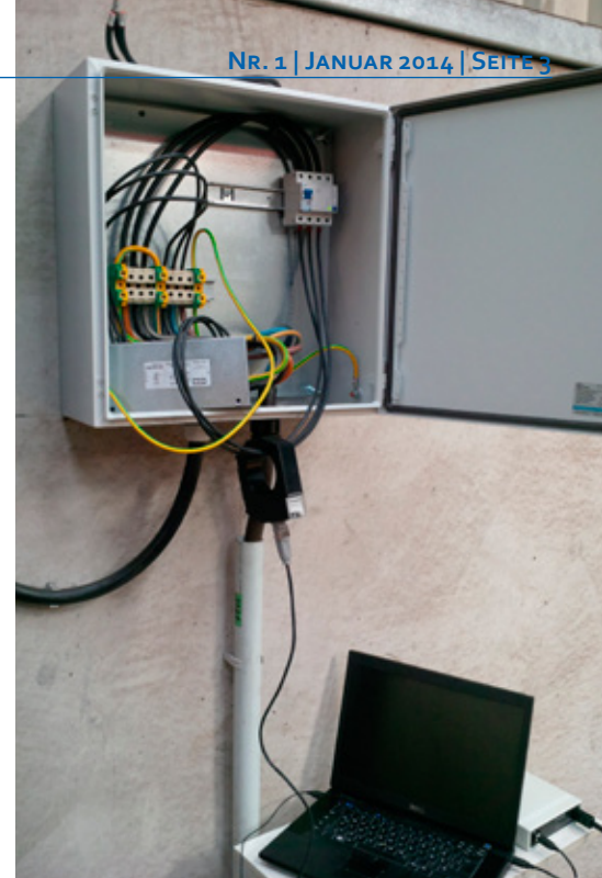
▲ Die Prüfanordnung: unten rechts im Bild DRCA 1 und Notebook. Der Wandler ist zur Diagnose nur lose eingebaut. Links unten im Verteilerkasten ist bereits das zu Testzwecken vorerst lose eingebaute EMV-Filter zu erkennen.

Nach der Installation eines zusätzlichen Filters wurden die Ableitströme erneut gemessen und es war nicht zu übersehen, dass sie durch das Filter auf ein Minimum reduziert werden konnten. Der vorher fast ausgelastete Fehlerstromschutzschalter war in der Folge nur noch mit 8 % belastet und damit weit entfernt von einer Auslösung.