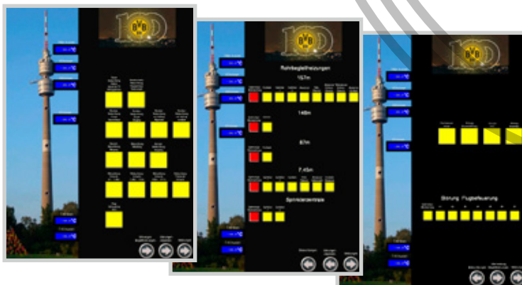
Nichts für Bayernfans: Drei Screenshots aus der Busvisualisierung des Floriansturms

Und auch Doepke konnte seinen Beitrag für den ältesten Fernsehturm der Welt mit Drehrestaurant leisten: Ein Großteil der Beleuchtung innen und außen wird von jetzt an mittels Dupline gesteuert, ebenso wie die Warnbefeuerung für den Flugverkehr auf der Turmspitze sowie am Plattformring und die Innenbeleuchtung der Wartungsräume.