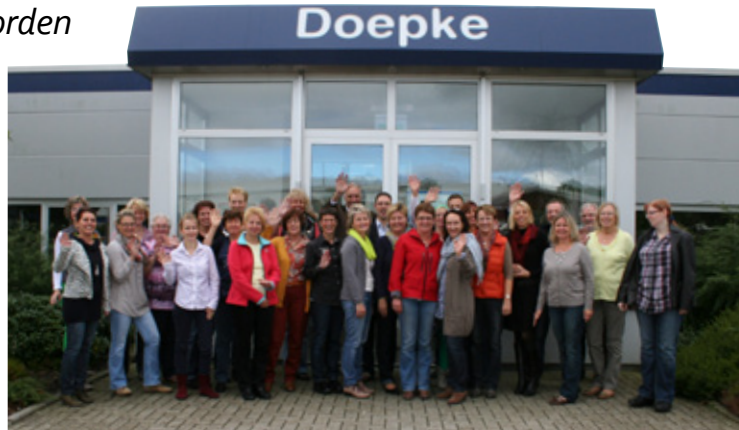
Gruppenbild mit Damen: Die Reisegruppe vor dem Doepke-Haupteingang

Zu Beginn der Tradition vor etlichen Jahren standen hauptsächlich Besuche bei Herstellern von Haushaltsgeräten auf dem Programm. Der technische Hintergrund und das Interesse der Teilnehmerinnen führten jedoch schnell zu einer Erweiterung des Besuchsprogramms: Viele sind Entscheiderinnen im eigenen Betrieb und möchten die Herkunft von Schaltern, Leuchten und nicht