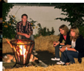
◀ Gemütliche Runde am Feuerkorb

Montabaur ging die Fahrt weiter in Richtung Nassau an der Lahn. Vom Niederwalddenkmal in Assmannshausen war der Ausblick auf das UNESCO-Weltkulturerbe sowie den Rheingau sehr eindrucksvoll. Vorbei am römischen Limes in Hilscheid ging es zurück nach Puderbach. Nach ca. 300 unfallfreien Kilometern und einem zünftigen Bikeressen endete der Tag mit viel guter Laune. Bereits fest im Terminkalender steht die 2. Motortour in 2015. Dann führt die Fahrt in das Erzgebirge. ■