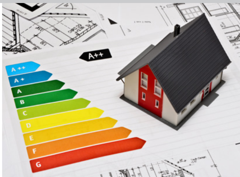
▲ Unsere Fehlerstromschutzschalter weisen eine niedrige Eigenerwärmung auf.

Die Fehlerstromschutzschalter der Baureihe DFS zeichnen sich durch ihre äußerst geringe Verlustleistung pro Pol aus. Selbst bei Nennstrom und bei einer Umgebungstemperatur von +40 °C sowie einer Einschaltdauer von 100 % entsteht im Vergleich zu Wettbewerbsprodukten eine Eigenerwärmung weit unter dem Durchschnitt. Für höhere Umgebungstemperaturen eignen sich die Fehlerstromschutzschalter in der Ausführung „HD“. Die maximal zulässige Umgebungstemperatur beträgt hier 60 °C. Aufgrund der niedrigen Eigenerwärmung ist auch